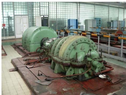
Компрессорный цех АвтоВАЗ ДО проекта